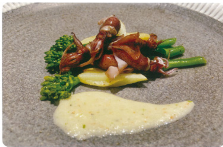
新ジャガイモと ホタルイカのサラダ