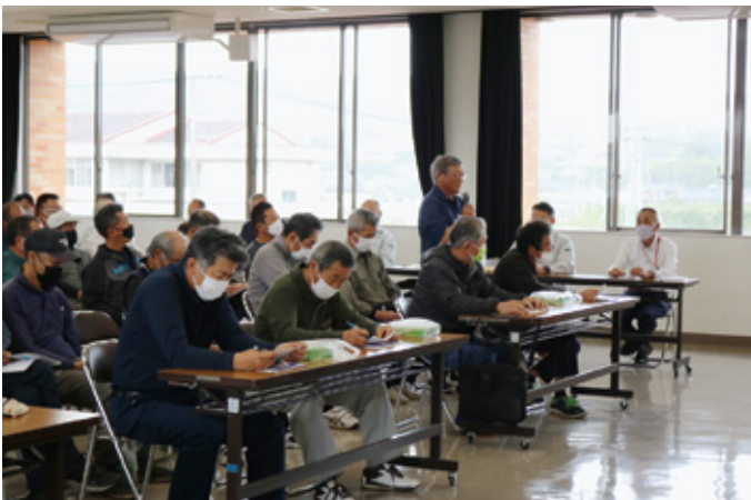
総代会前座談会 都農

延長による収量への影響は、R4年度より3カ年で総合農業試験場において実証試験（生育・収量・品質に及ぼす影響について）を実施していますが、試験途中により結果は出ていません（ただし、1年目の考察では茎数抑制により粗数が減少し、気象条件によっては減収の危険性もあるとのことでした）。また、農研機構がまとめた報告による