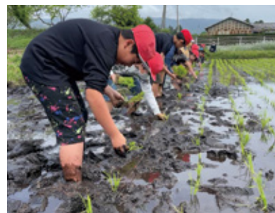
川南東小学校 田植え