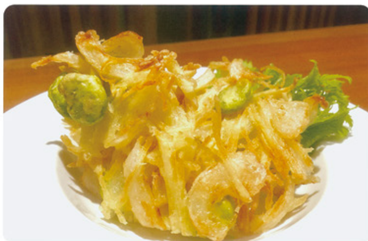
新タマネギと 新ジャガイモの かき揚げ