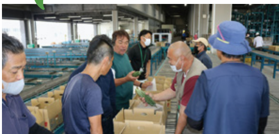
等級を確認し合う部会員

ゴーヤ研究会は5月10日、J A尾鈴中央選果場にて目揃え会を行い、会員、J A職員合わせ11名が参加し