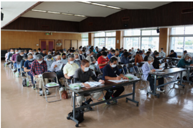
総代会前座談会 川南

しかし当年は昨今の農業情勢等の影響を受け、生産コストが上昇したことに加え、ほうれん草の作柄が悪かったことを主な要因に当期利益は赤字に転じました。品目が多岐にわたること、収穫班やトレーニングハウスの関係等、担う役割が煩雑化してきておりますので、農産園芸部門との連携を強化し、収支の改善を目指します。