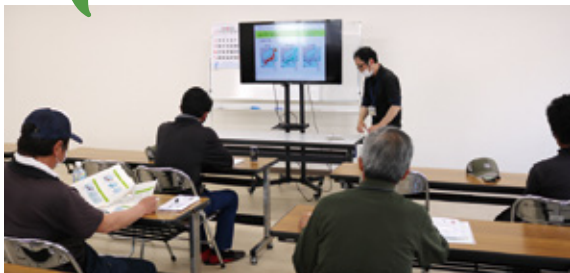
説明を聞く部会員

4月18日、J A尾鈴露地胡瓜部会は品種説明会を開き、部会員、J A指導員あわせて10名が参加