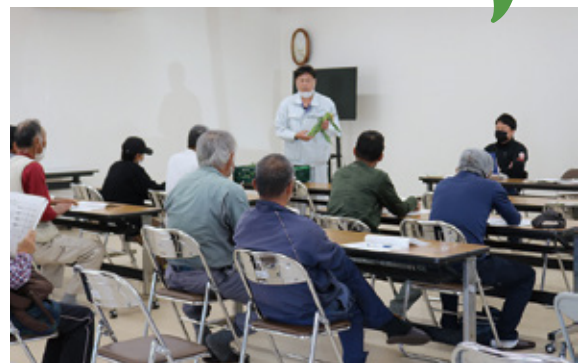
説明を受ける部会員